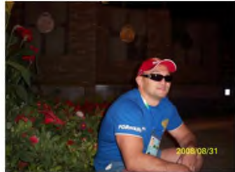
Un moment de respiro, în satul Paralimpic. Beijing, 2008