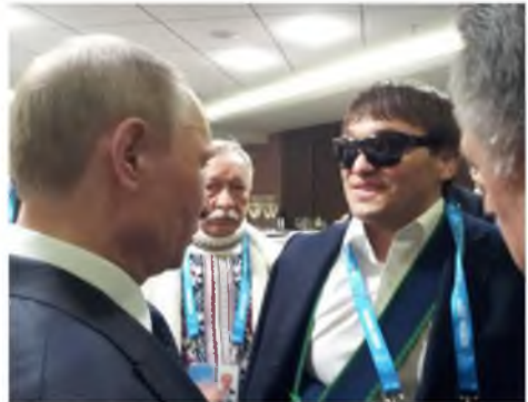
Un schimb de opinii cu președintele rus Vladimir Putin referitor la perspectivele judo-ului pentru nevăzători