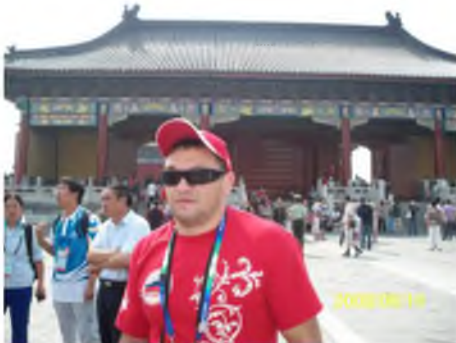
O clipă de relaxare la Palatul Imperial din Beijing. Anul 2008